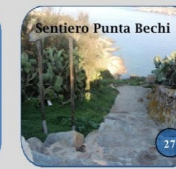
Sentiero Punta Bechi