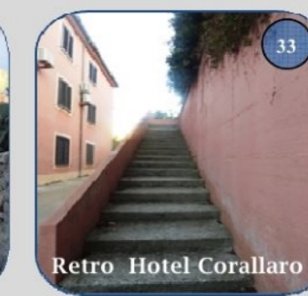
Retro Hotel Corallaro