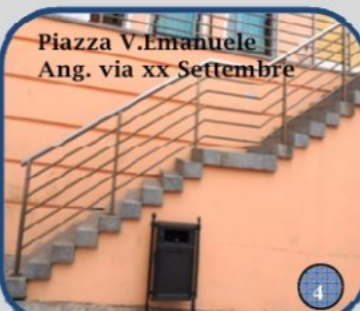
Piazza V.Emanuele Ang. via xx Settembre