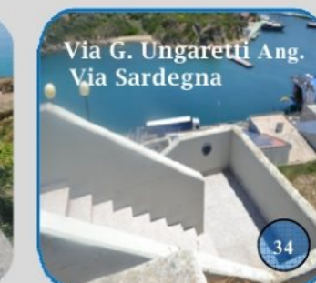
Via G. Ungaretti Ang. Via Sardegna