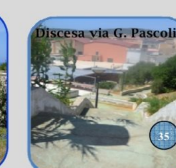
Discesa via G. Pascoli