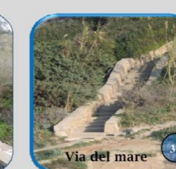
Via del mare