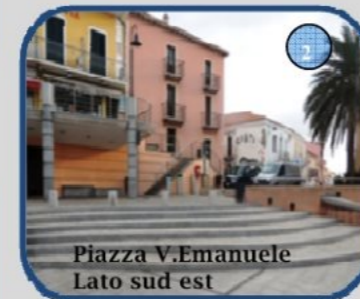
Piazza V.Emanuele Lato sud est