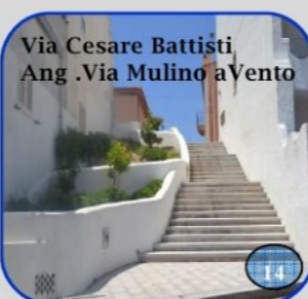
Via Cesare Battisti Ang. Via Mulino a Vento