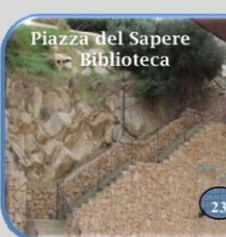
Piazza del Sapere Biblioteca