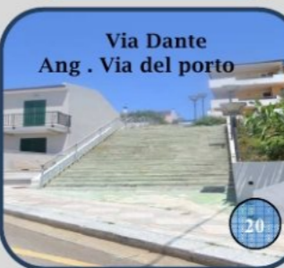
Via Dante Ang. Via del porto