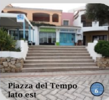
Piazza del Tempo lato est