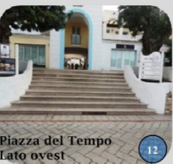
Piazza del Tempo lato ovest