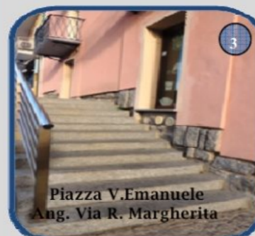
Piazza V.Emanuele Ang. Via R. Margherita