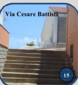
Via Cesare Battisti