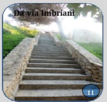
Da via Imbriani