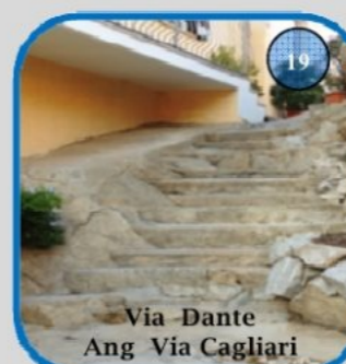
Via Dante Ang. Via Cagliari