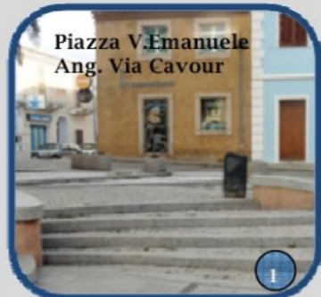
Piazza V.Emanuele Ang. Via Cavour