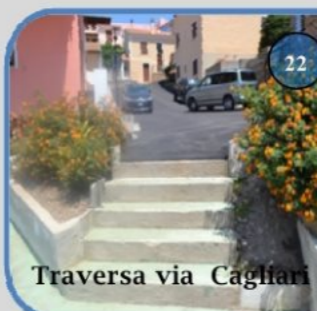
Traversa via Cagliari